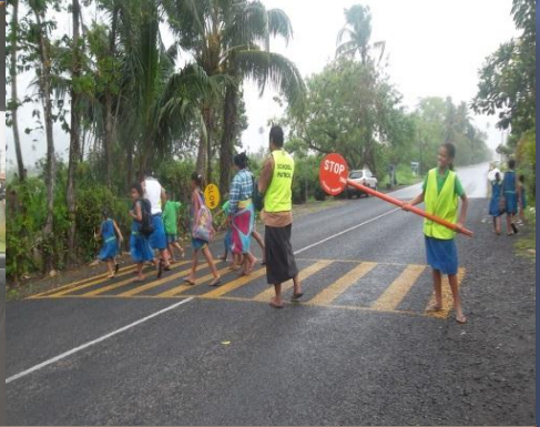
SAOGALEMU LE MAMALU FEAFIOA'I