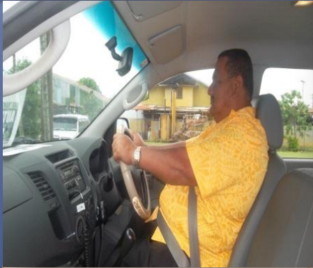
SAOGALEMU AVE TAAVALE